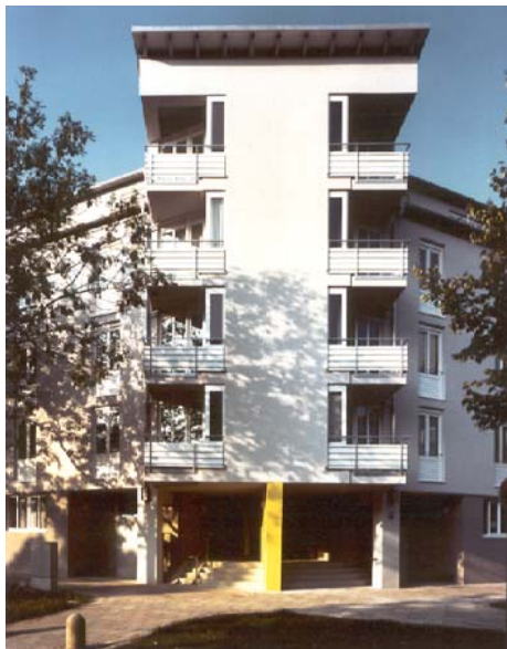
Erker zur Georgenschwaigstraße