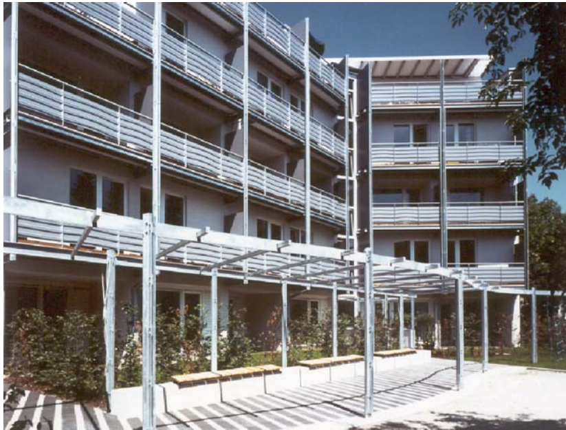
Gartenseite mit Pergola